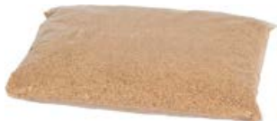
Räuchermehl (ca. 400g)