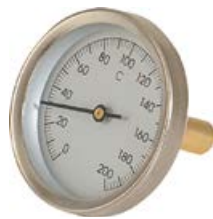
Thermometer mit Thermometerhülse