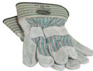
Handschuhe (1 Paar)