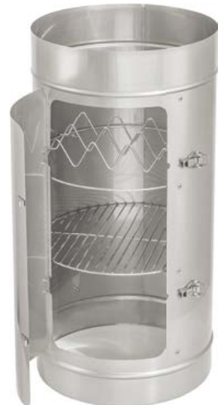
Räuchersegment mit Tür